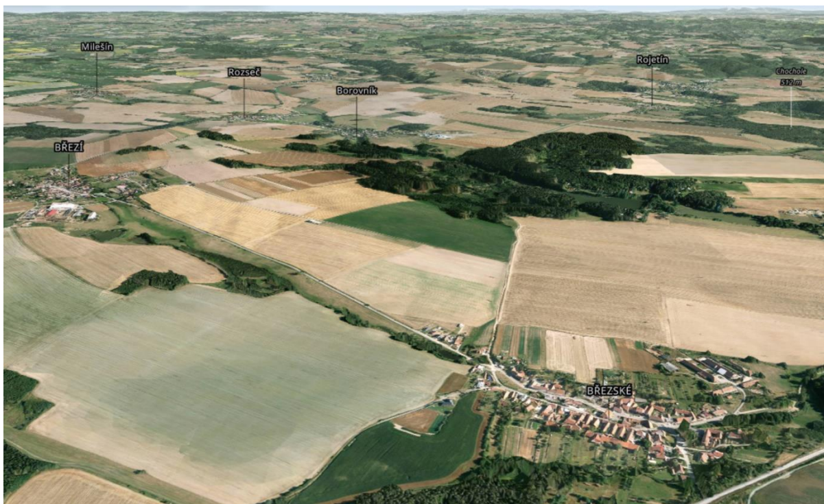
Stávající polní letiště mezi obcemi Březí a Březské